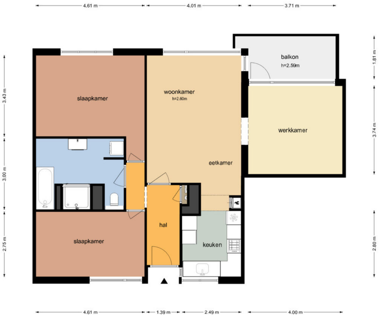
Laan van Ouderzorg 73 - Leiderdorp Eerste Verdieping

De plattegronden zijn geproduceerd voor promotionele doeleinden en ter indicatie. Aan de plattegronden kunnen geen rechten worden ontleend © www.objectenco.nl